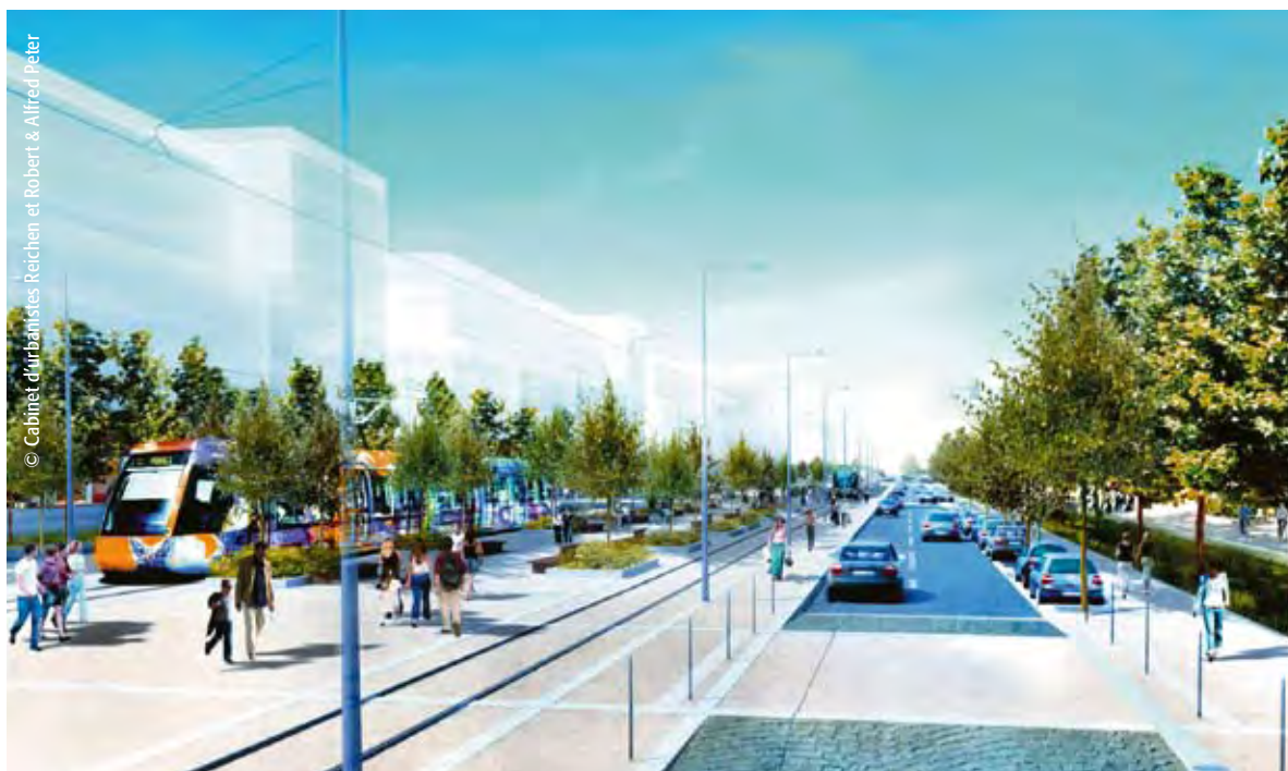
Le passage de la ligne 3 de tramway implique la transformation de l'avenue de la Mer en une artère urbaine.

La route de la Mer, projet phare du Schéma de Cohérence Territoriale de Montpellier Agglomération, est un axe urbain majeur, allant du cœur d'Agglomération au littoral. L'enjeu consiste à transformer la route actuelle en une avenue « vitrine » de l'Agglomération, une véritable entrée de ville.